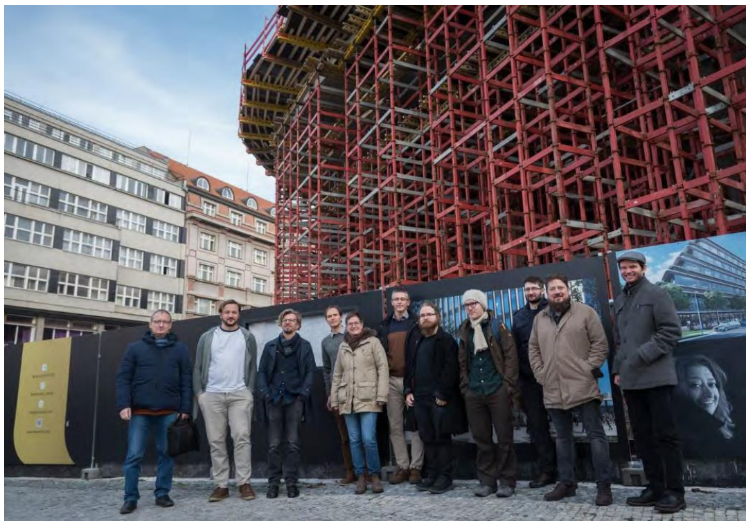
Obr. 5: Pražské setkání členů Bibliographical Data Working Group

(žádost odeslána v prosinci 2021, v březnu 2022 návrh získal podporu) a příprava společného projektu COST zaměřeného na zpracování a výzkum bibliografických dat.