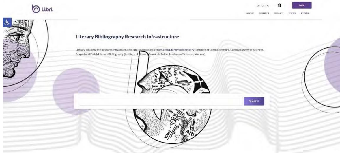
Obr. 4: Domovská stránka portálu literarybibliography.eu