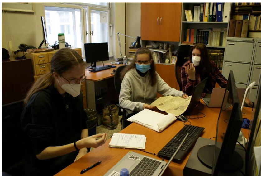
Obr. 3: Stážistky z programu Otevřená věda

Tým Biografického archivu se zaměřil převážně na budování, migraci a čištění dat databáze České literární osobnosti. Též vytvářel podporu pro databázi Česká literární bibliografie formou tvorby nových národních autorit a čištění rejstříků jmenných autorit v bázi ČLB. V rámci projektu Harmonizace databází personálních autorit ÚČL AV ČR, v. v. i., se souborem národních autorit NK ČR, podpořeného v rámci programu MK ČR VISK 9, byla propojena další část personálních autorit z dílčích bází ČLB se souborem národních autorit. Projekt probíhal v termínu březen–prosinec 2021. Podíleli se na něm 3 externisté, kteří při objemu práce 0,5 úvazku po dobu 5 pracovních měsíců zpracovali 43 858 „rejstříkových položek“.